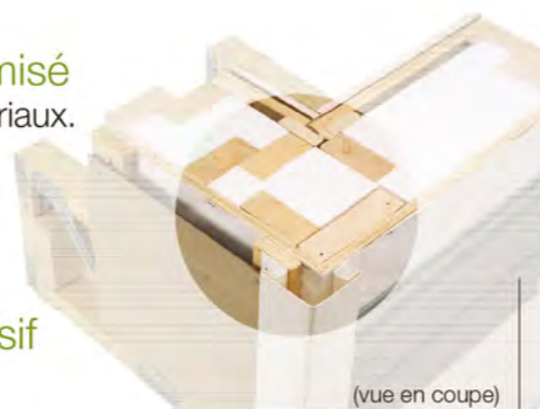
(vue en coupe)

Système d'isolation haute performance. Portes et fenêtres à haute efficacité. Des économies d'énergie significatives.